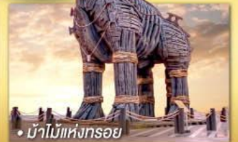
• บ้านไม้แห่งทรอย