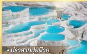
• ปราสาทปูยนิาย