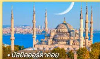
• มัสยิดออร์ตาคอย